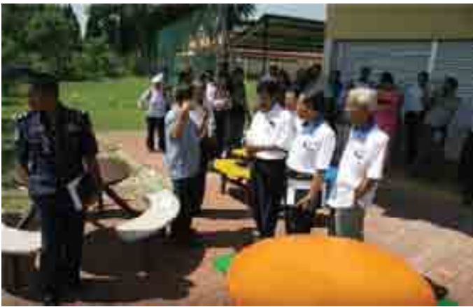
Datuk Bandar mendengar penerangan ADUN Manjoi, YB Dato' Nadzri.

Berikutan masalah itu, stadium mini ini tidak boleh digunakan kerana perlawanan bola sepak formal dan kompetitif tidak dibenarkan diadakan di situ.