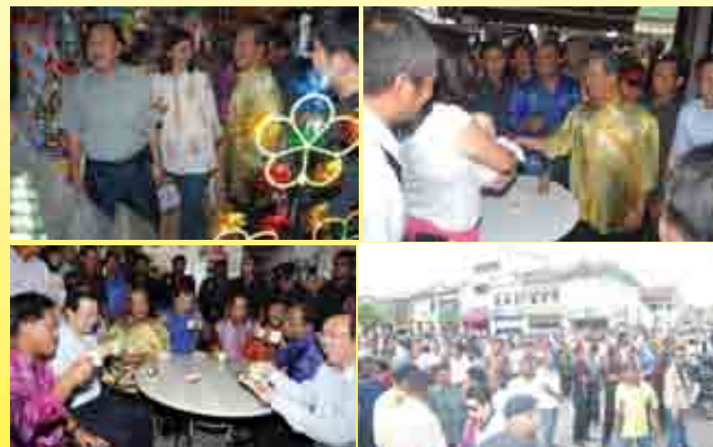
TPM YAB Tan Sri Muhyiddin Yassin meninjau dan beramah mesra dengan peniaga di Little India.

The construction of the arch and the painting of the buildings will start simultaneously.