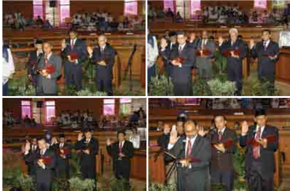
Sebahagian 24 Ahli Majlis MBI berdiri mengangkat sumpah.

Beliau berharap Ahli Majlis dapat menabur khidmat bakti kepada warga kota dengan berkongsi idea dan pengalaman yang dimiliki.