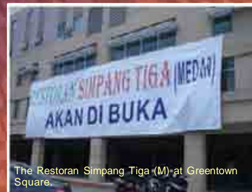
The Restoran Simpang Tiga (M) at Greentown Square.

The Simpang Tiga Restaurant in Ipoh will be located at the Greentown Business Square with a seating capacity for 300 patrons at any one time.