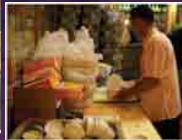
A Restoran Simpang Tiga staff in Medan busy preparing pack meals for take-away.

It has since become a family business with his wife and children being involved in its day-to-day running.