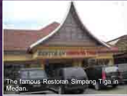
The famous Restoran Simpang Tiga in Medan.