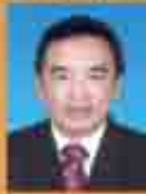
Chh. H. Lal Kang Prasa (NGO)

ZON 13 (GREENTOWN/ PEKAN LAMA/ MEDAN KUDA)