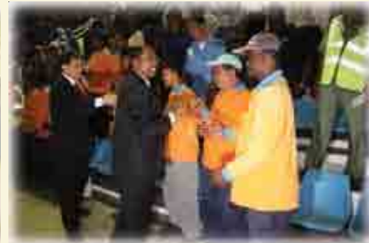
YAB Dato' Seri Dr. Zambry beramah mesra dengan kakitangan MBI.