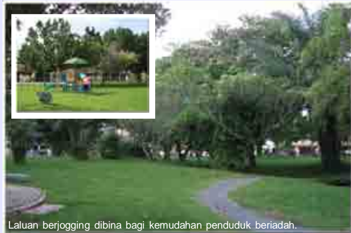
Laluan berjogging dibina bagi kemudahan penduduk beriadah.

Apart from decorative plants, the garden also boasts of pandanus leaves and pamelos trees that not only provide shade but also fruits that are shared among the residents.