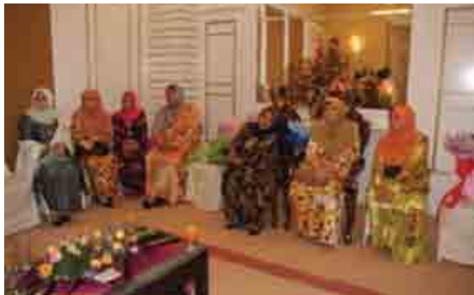
Isteri-isteri mantan-mantan Datuk Bandar Ipoh yang turut hadir pada jamuan itu.