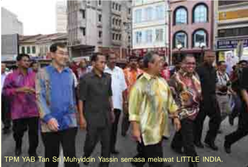
TPM YAB Tan Sri Muhyiddin Yassin semasa melawat LITTLE INDIA.

LITTLE INDIA di Ipoh akan mengalami transformasi secara keseluruhan berikutan rancangan Kerajaan Persekutuan untuk memperindah kawasan itu dan mempromosikannya sebagai destinasi tarikan pelancong.