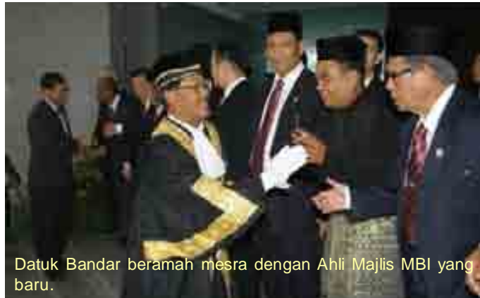
Datuk Bandar beramah mesra dengan Ahli Majlis MBI yang baru.

"Peranan Ahli Majlis cukup besar dan saya berharap pelaksanaan Jawatankuasa Perhubungan Kawasan (JPK) pada tahun ini dapat diteruskan serta lebih berjaya berbanding tahun-tahun sebelumnya," katanya.