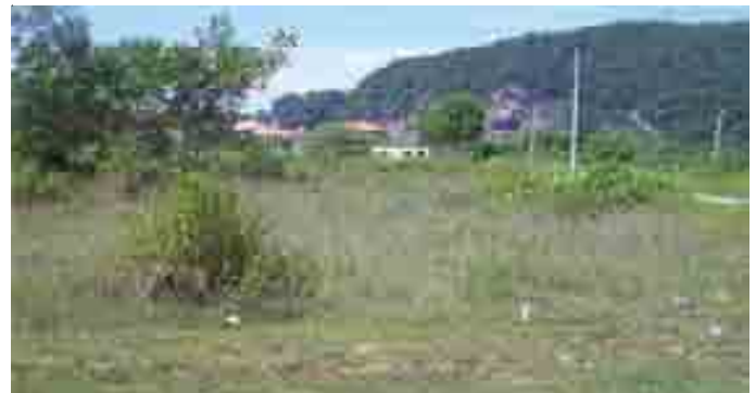
Lot tanah terbiar di Kampung Sengat, Simpang Pulai yang ditumbuhi pokok liar.

Beliau juga turut mengumumkan kelulusan pembinaan 200 bonggol jalan di kawasan kampung selain RM200,000 untuk menurap semula jalan di kampung yang telah lama rosak bagi keselesaan penduduk.