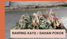
RANTING KAYU / DAHAN POKOK