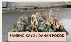
RANTING KAYU / DAHAN POKOK