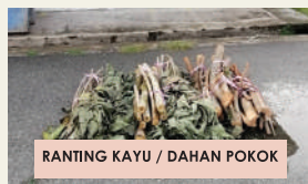
RANTING KAYU / DAHAN POKOK