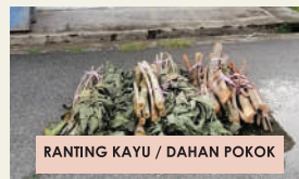
RANTING KAYU / DAHAN POKOK